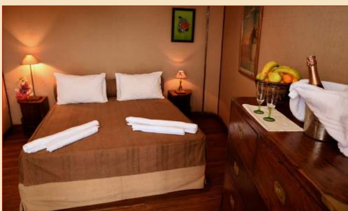
Suite Luxe de popa