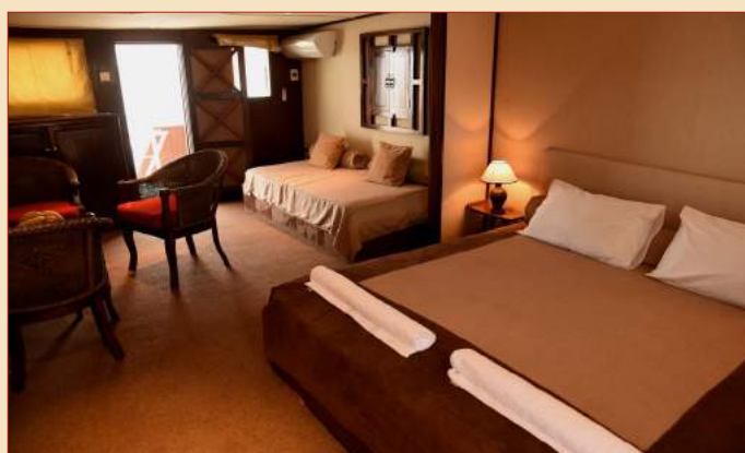
Suite Luxe de proa

Los camarotes Estandar están equipados con lavabo, ventilador y armario (el barco pone a disposición de los pasajeros 6 cabinas para el lavabo y 6 cabinas para la ducha).